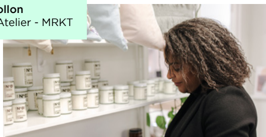
Régine Apollon Kaméléon Atelier - MRKT